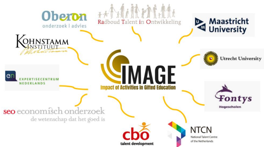
Figuur 1 Overzicht van de consortiumpartners binnen IMAGE

Binnen IMAGE worden verschillende subthema's en een overkoepelend thema onderscheiden. In Figuur 2 zijn deze weergegeven. Subthema A betreft activiteiten die worden uitgevoerd op het gebied van signaleren en identificeren van (hoog)begaafde leerlingen. Subthema B betreft activiteiten op het gebied van onderwijsaanpassingen voor (hoog)begaafde leerlingen. Subthema C betreft activiteiten die te maken hebben met het combineren van expertise (uit onderwijs en zorg) in complexe situaties. Deze complexe situaties betreffen bijvoorbeeld (dreigend) schooluitval en/of dubbel-bijzondere leerlingen die enerzijds zeer hoge intellectuele capaciteiten en/of hoge leerresultaten hebben en anderzijds (kenmerken van) leer-, ontwikkelings- en/of gedragsproblemen vertonen (Burger-Veltmeijer et al., 2018). Subthema D betreft het organisatieperspectief waarbij de manier centraal staat waarop samenwerkingsverbanden samenwerking faciliteren en sturen om het passend onderwijs aan (hoog)begaafden te verbeteren. Subthema E betreft ontwikkeling van expertise en richt zich met